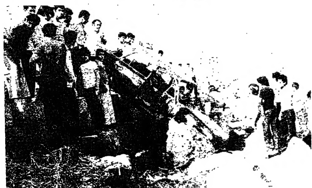
سيارة تدهورت قرب «مخيم البص» بعد اصابة سائقها برصاص العدو